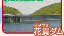
はなめぐ 花貫ダム