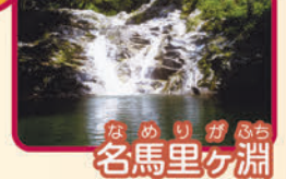
なめりがらち 名馬里ヶ淵